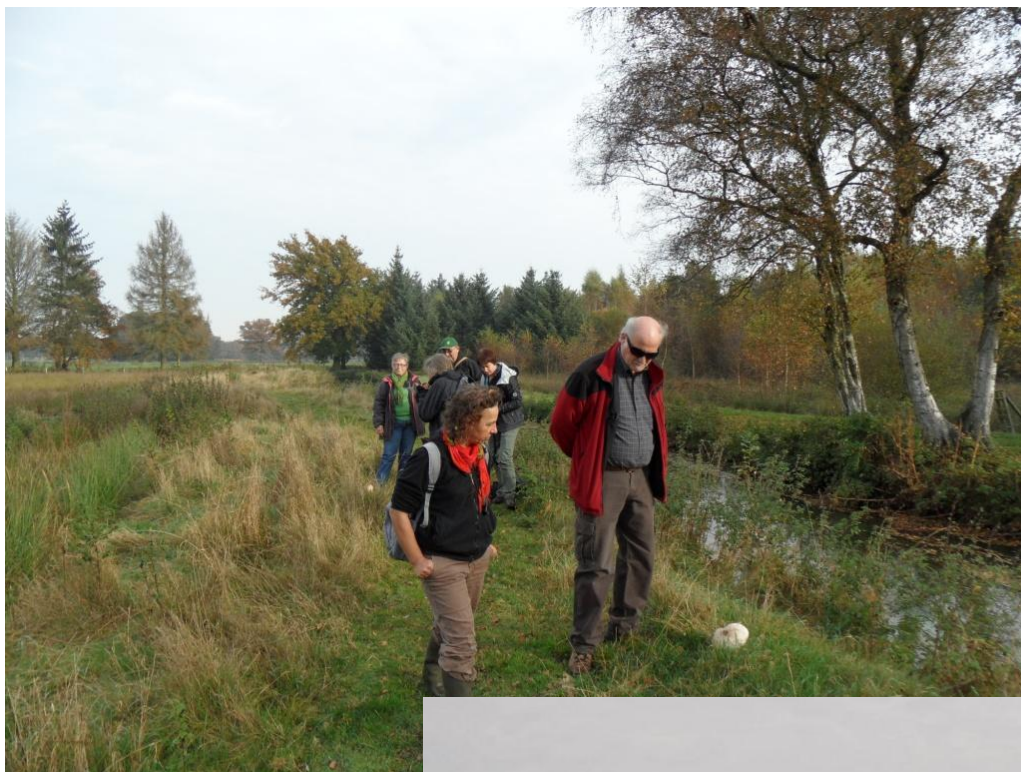
de voorwaartse waarnemers