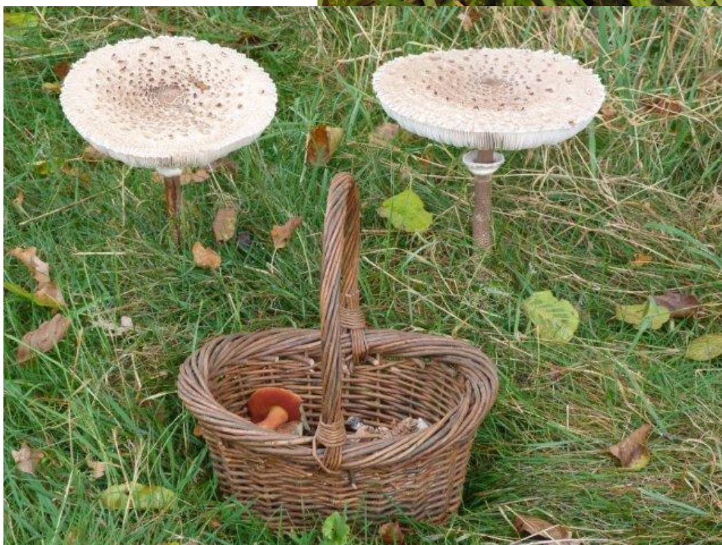
Te groot voor mijn mandje de grote parasolzwam