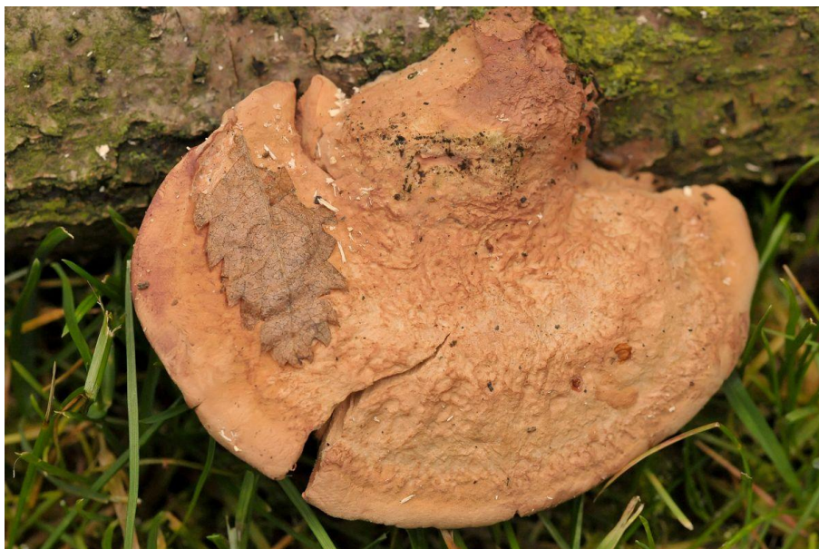
De kussenvormige houtzwam voor...