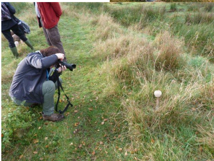
de fotograaf in volle actie